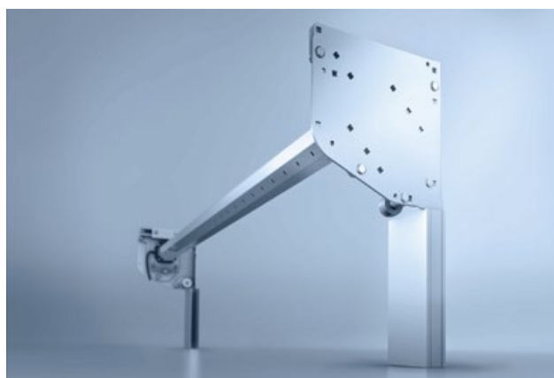
2 Offene Rolltor-Montage ohne Kasten