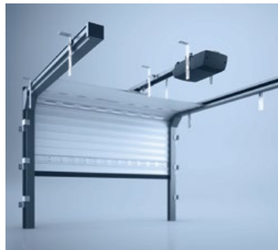
2 Deckentor heroal OD 75