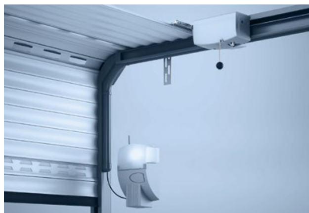
3 Deckentor-Montage mit Seitenantrieb

4 Montage mit Mittelantrieb – Rolltore bis zu einer Größe von 4 x 4 m können mit dem Mittelantrieb gefahren werden.