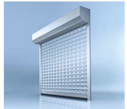
3 Rollgitter heroal RG 90