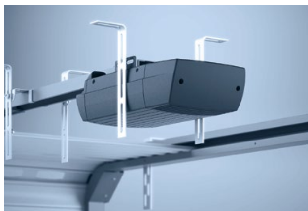
4 Deckentor-Montage mit Mittelantrieb