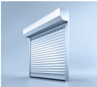
1 Rolltor heroal RD 55/75