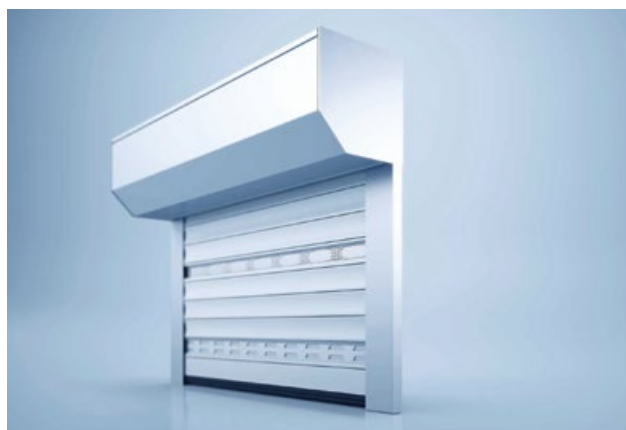
1 Geschlossene Rolltor-Montage im Blendenkasten

2 Montage ohne Kasten – Besonders breite und hohe Rolltore werden in der offenen Montage umgesetzt.